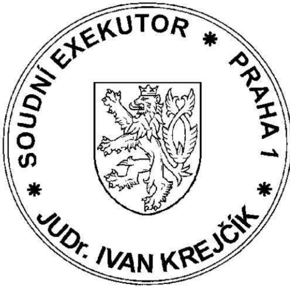
Obrázek - Vzor otisku razítka