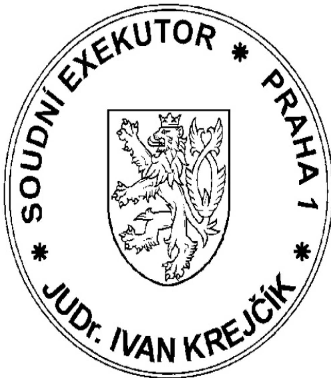
Obrázek - Vzor otisku razítka